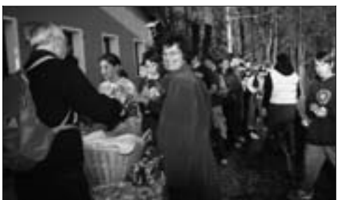
Sempre gradita la castagnata a Col Fiorito.