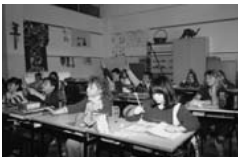
Tanta voglia di imparare anche in terza.