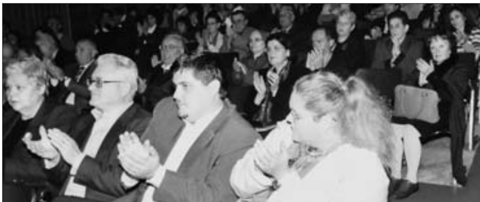
Applausi alle parole di riconoscenza del Vescovo per l'opera dei Salesiani.

Questo il senso di una rilanciata scommessa salesiana a Belluno.