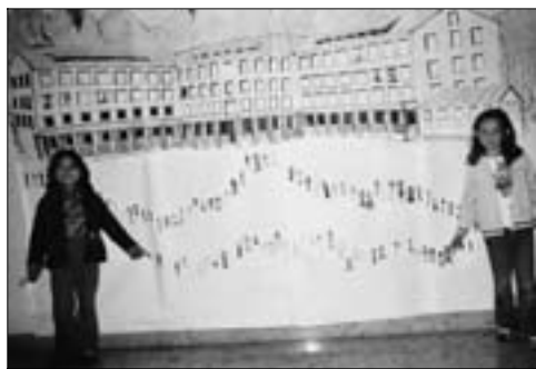
Il grande cartellone raffigurante l’Agosti popolato dai suoi beniamini.