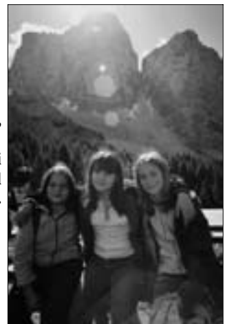
Stanche, ma sorridenti sotto il Pelmo.

Rientro a Belluno tranquillo, rallegrato da una gara di barzellette.