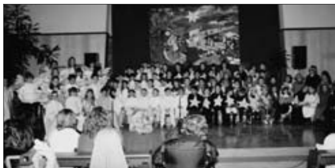
La grande recita di Natale: tutti in scena.