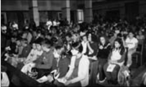
Riparte la scuola: volti sereni e fiduciosi.

Ovviamente è necessario essere originali, fare colpo, come si dice, soprattutto se la circostanza riguarda l'inizio dell'anno scolastico.