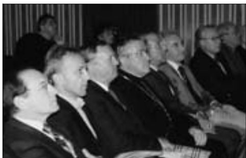
Tutta la Belluno "istituzionale" presente.

Secondo il padre gesuita, che ha parlato quasi esclusivamente della famiglia, l'educazione dei figli è sempre stata un problema difficile. La modernità però l'ha reso ancora più complesso perché tende a cambiare la struttura della famiglia. Questa viene