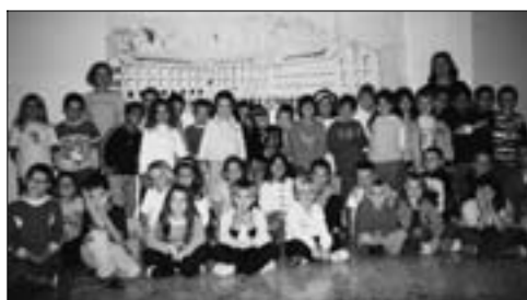
I nuovi “acquisti” abbracciati dall’Agosti.