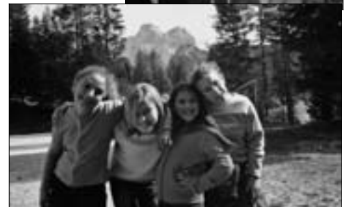
Sorrisi anche dalla Casa Alpina Salesiana.