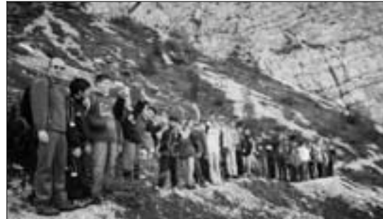
Prudenza e "disciplina" sotto il Pelmetto.

Ospiti i ragazzi della classe prima; padroni di casa quelli di seconda.