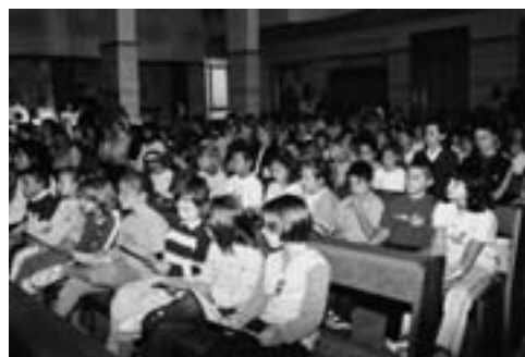
Accolti con gioia nella famiglia di don Bosco.