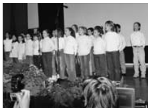
Si canta per l’associazione “Pollicino”.

Verso Pasqua saranno impegnati in altre attività».