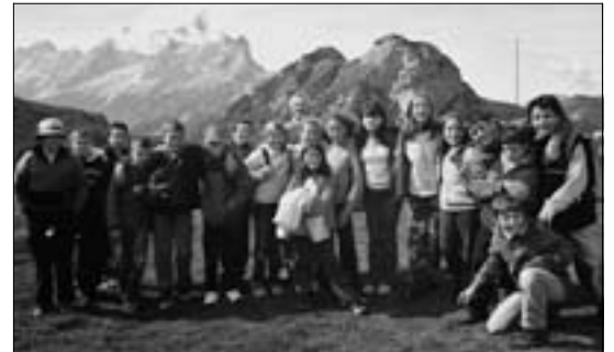
Gli "ospiti" della prima: tanta felicità.

Qui ammiriamo anche un altro suo ritrovamento riprodotto in calco: le impronte di dinosauri del Pelmetto. Si spazia lungo i secoli dalla geologia alla paleontologia, alla storia