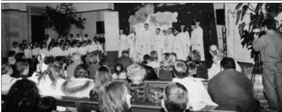
Successo della rappresentazione natalizia delle scuole primaria e secondaria "Agosti".

ore 20.30 Giovani in Concerto, rassegna musicale in onore di S.G. Bosco.