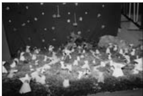
Il loro presepe di statuine fatte con le pigne.