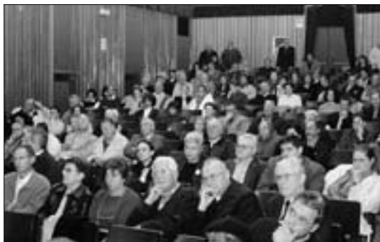
Pubblico qualificato e partecipe.

catura tra la sfera della vita familiare e quella del lavoro. Rimane primario il compito della testimonianza da parte dei genitori rispetto alle scelte dei figli. «Noi genitori possiamo soltanto indicare la strada e dare il buon esempio», ha detto il padre di Anna Frank in un momento in cui la figlia avvertiva i problemi dell'adolescenza.