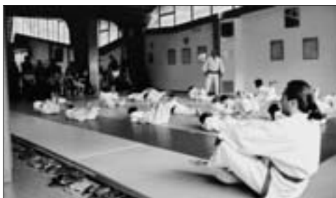
Tanta "scuola" prima dei collaudi in pubblico.

Tema insolito per quelle aule e forse anche per la commissione che tuttavia ha mostrato vivo interesse per la ricerca e per un'associazione relativamente giovane, benemerita, di notevole incidenza sociale, ampiamente diffusa.