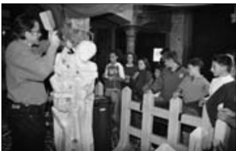
Imparando le tecniche scultoree.

Così ridimensionata la metafora risulta meglio contestualizzata e può quindi rappresentare e stimolare l'azione educativa e didattica di una scuola facendola apparire giustamente come convergente complesso di iniziative formative attivate dinamicamente per lo sviluppo e la crescita dei nostri ragazzi.