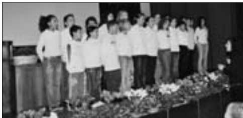
Le note festose del coro della media "Agosti".