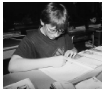
La strategia di Federico.

Terzo tratto di una sana pratica pedagogica è l'amore che, ha osservato don Dante, soprattutto oggi richiede molto cervello, oltre che cuore, molta riflessione e molto buon senso. Anche per don Bosco l'amore non è solo "fatto di cuore", ma disegno meditato a fondo.