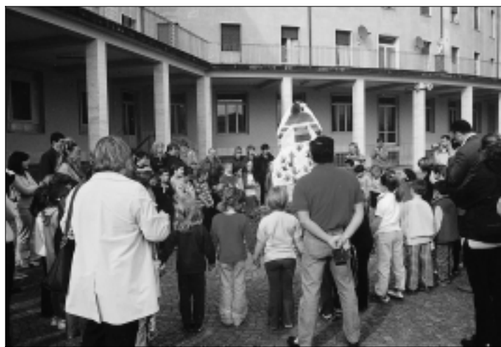
Il grande cerchio di bambini e di genitori attorno alla "vecia".

Bondì, me presente: son la vecia della pace, al mè vestì l'è fat de straze, straze de mille colori: cuori di bambini, forse un po' piccini, ma che chiedono grandi cose: chiedete la PACE e l'AMORE e un mondo a forma di cuore. Adès che fae testamento, ve lase sto vestì fat de straze che l'ha i colori della pace: rosso è l'amor, arancione e gial com 'l sol, verde è la speranza, azzurro e indaco la bona creanza... E in fine il violet che brusa subito co' sto foghet. Speron che 'l fumo porte al mè vestì de la pace su dal Signor in Paradiso, così che a tute le persone de sto mondo ghe regale un bel sorriso e questo nostro girotondo... ... e sia la PACE in tutto il mondo!