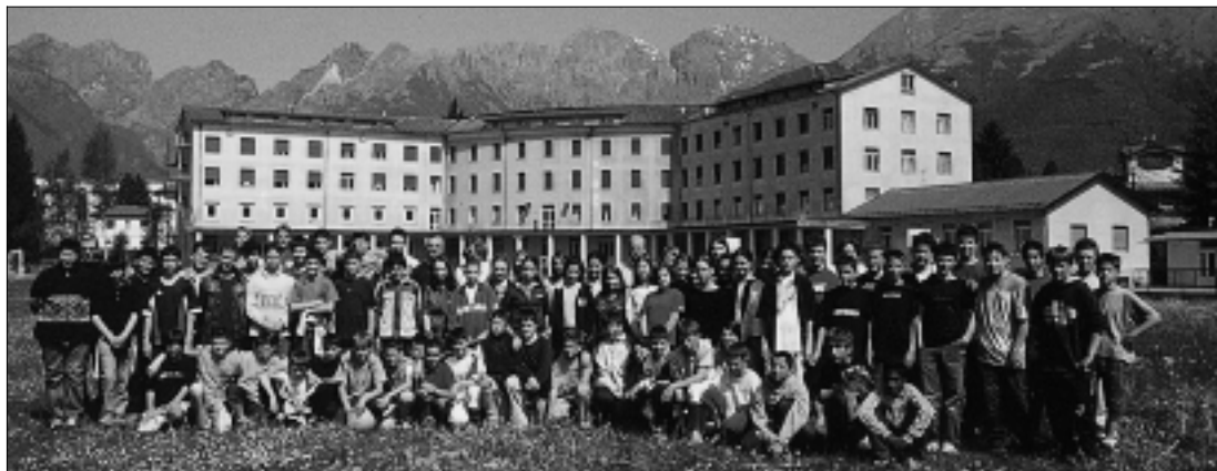
La Scuola Media incorniciata dall'Agosti e dalla chiostra della Schiara sullo sfondo.