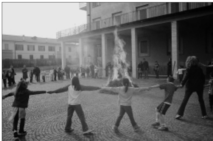
Girotondo attorno al rogo-falò.