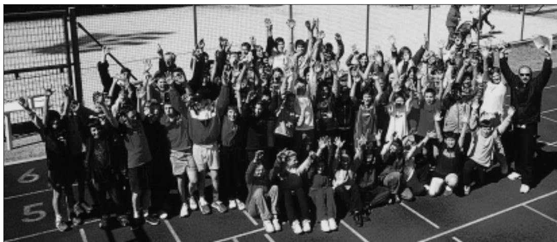
Allegria e tanta voglia di competere ai Giochi della Gioventù.

È finito il tempo delle polemiche. Bisogna rimboc-